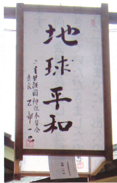
乙部会長御奉納の行灯

乙部会長には、境内に掲げた六千余灯の提灯行灯に明かりを灯す「点灯式」を始め、期間中の祭典に参列され、奉賛会員を代表し玉串を奉りて拝礼された。