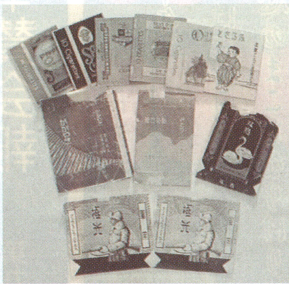
マッチ箱、煙草の包紙収集品