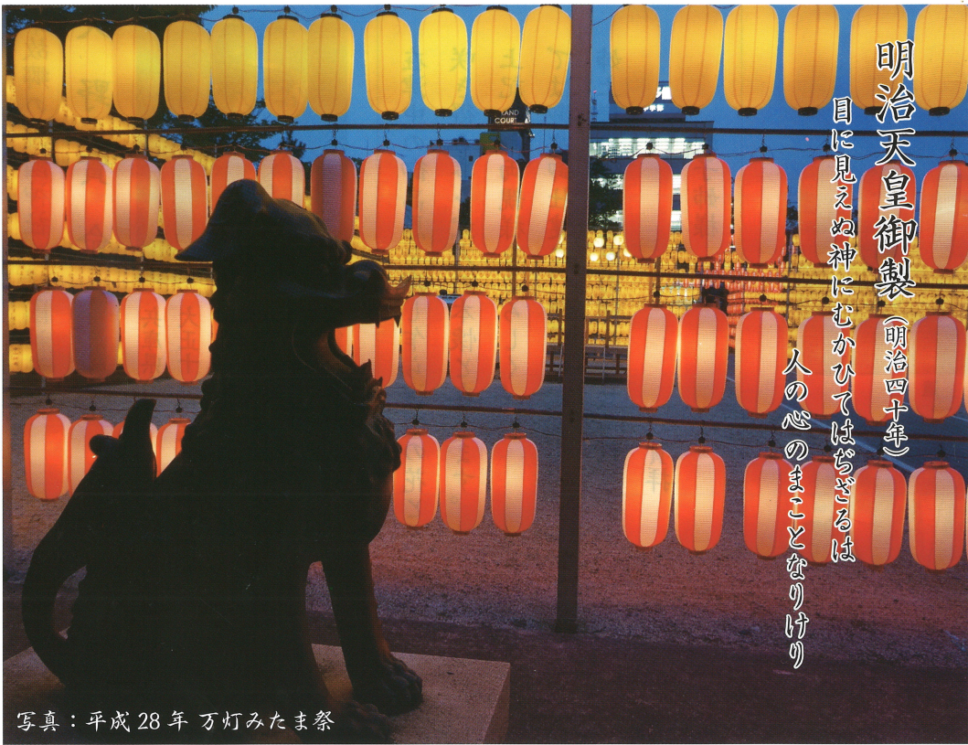
写真：平成 28 年 万灯みたま祭